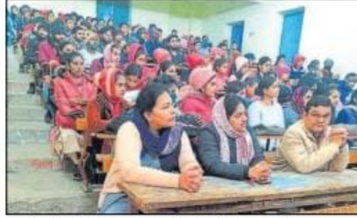
शहर के पटेल कॉलेज में बुधवार को आयोजित संगोष्ठी में भाग लेते लोग। • शिन्दुलन

बार बिहार कुमारी का खिताब जीता है। शाहाबाद केसरी और कैमूर केसरी का खिताब भी झटक चुकी है। अन्न शुरू में बिछियां व्यायामशाला में प्रैक्टिस करती थी लेकिन बाद में जिला प्रशासन ने लड़कियों को प्रैक्टिस करने पर प्रतिबंध लगा दिया। फिर वह निरगुण होकर बिहार से बाहर प्रैक्टिस करती है और अपने दमखम व दांवपेंच से बिहार का नाम रौशन कर रही है।