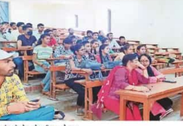
कार्यक्रम के दौरान मौजूद शिक्षक और छात्र

प्रसार भारती नई दिल्ली से मिलेगा सर्टिफिकेट