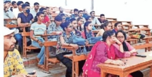
कार्यक्रम में उपस्थित छात्र-छात्राएं व शिक्षिकाएं ● जागरण

कार्यक्रम को संबोधित करते आकाशवाणी टीम के सदस्य ● जागरण