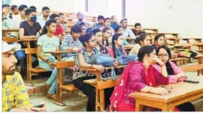
बैठक के दौरान मौजूद आकाशवाणी के पदधिवारी व पटेल कॉलेज के प्रोफेसर.

चयनित छात्र-छात्राओं को मिलेगा नकद पुरस्कार व प्रशस्ति पत्र